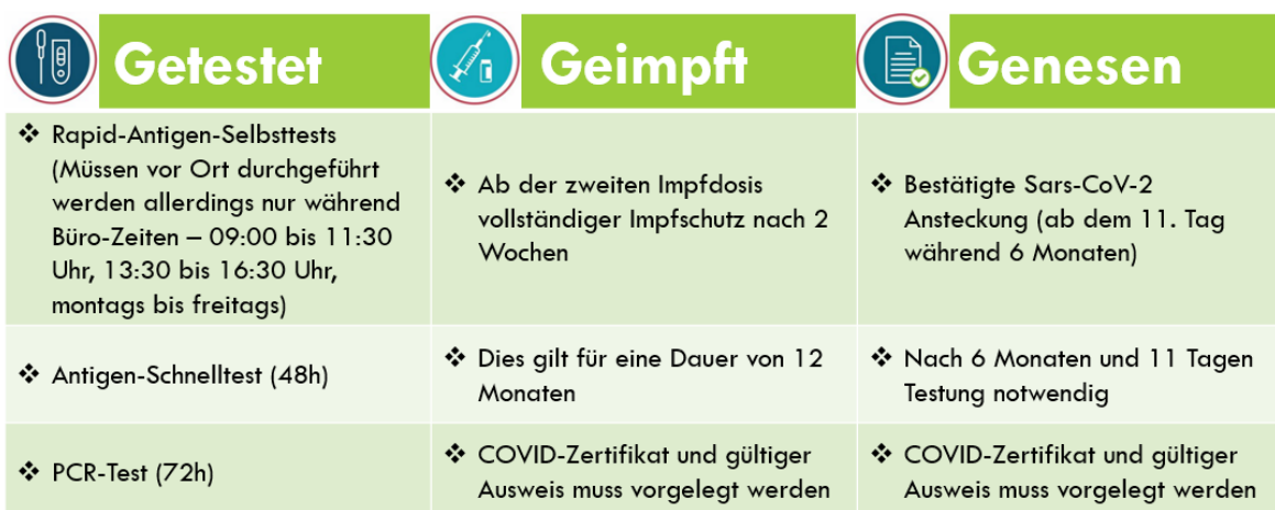
Abb. 1 (Besucherregelung Covid-19, Voraussetzungen)

«3G» als Voraussetzung für das Betreten des Hauses: